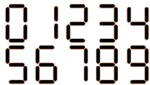
Рис. 1: Примеры того, как на 7-сегментном индикаторе отображаются все цифры.

Ковальски не умеет читать, зато умеет считать. Поэтому он хочет, чтобы при вводе пароля, загорелось ровно n сегментов (единичных отрезков, из которых состоят 7-сегментные индикаторы). Так же Ковальски не хочет, чтобы его пароль подобрали слишком быстро, поэтому среди всех подходящих паролей он хочет найти тот, который соответствует максимальному числу.